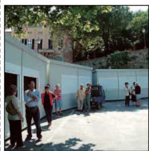
Sistemazione provvisoria del mercato del pesce