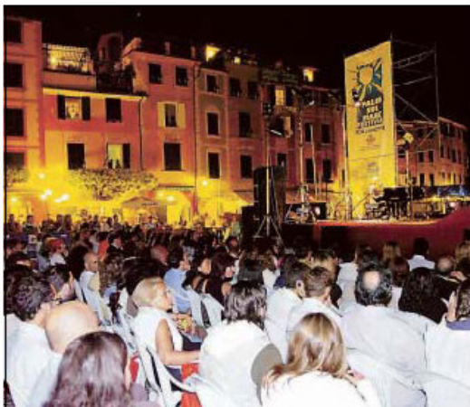
La piazzetta di Portofino gremita per il concerto di Cammeriere