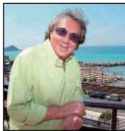
Tullio De Piscopo ieri a Cavi

Lavagna. Tullio De Piscopo porta il jazz a Cavi borgo, il percussionista napoletano è il testimonial del festival "Jazz & wine" e, con il concerto di stasera (21,30), inaugura la rassegna promossa da Comune e Civ. Sei appuntamenti gratuiti, fino all'11 agosto, con artisti di fama internazionale e giovani talenti. Non semplici spettacoli, ma eventi alternati e accompagnati da degustazioni di vini offerti da sei case produttrici di Liguria, Piemonte, Veneto e Trentino Alto Adige.