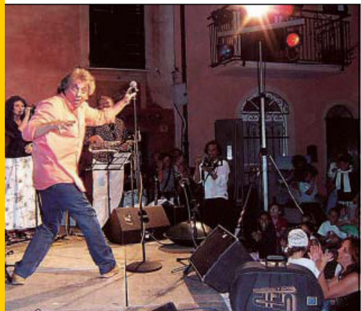
Tullio De Piscopo trascina il pubblico a Cavi Borgo